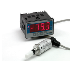
Easidew Online 在线露点仪