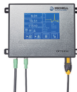
Optidew 501 冷镜式露点仪