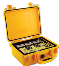
YellowBox Portable 便携式氧分仪