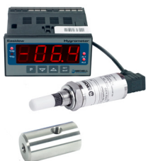
Easidew Online 露点仪