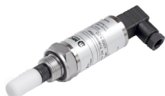
Easidew Tx 工业露点仪