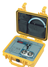
MDM50 Portable 湿度仪