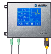
Optidew 501 冷镜式露点仪

PST集团|密析尔仪表(上海)有限公司 上海市徐汇区宜山路889号齐来工业城4幢6层D1单元